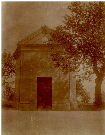
Oratorio di San Valeriano (distrutto)

La bella immagine è del 1911, opera giovanile dello scultore Bernardino Boifava. Viene festeggiata solennemente la prima domenica d'ottobre.